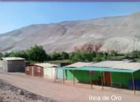
Inca de Oro