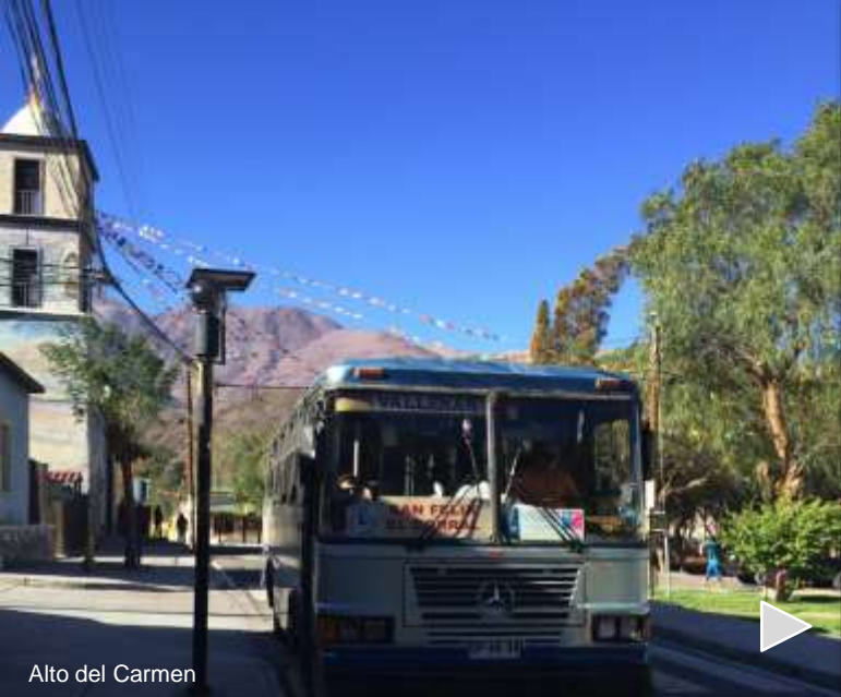
Alto del Carmen